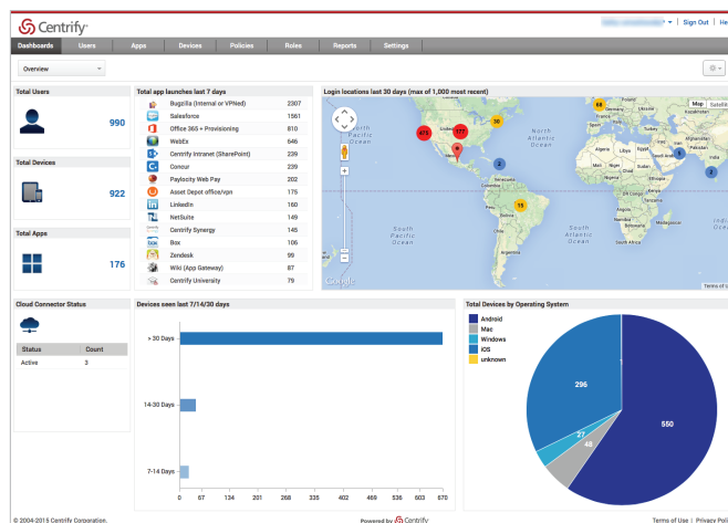
Der Identity Service Cloud Manager gibt IT die Kontrolle über Apps, Geräte und Richtlinien.